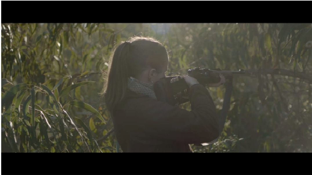
Isaki Lacuesta. L'acusat (un cas del sud)