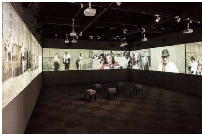
Isaki Lacuesta. Les imatges eco .