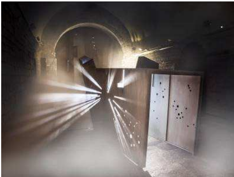
Isaki Lacuesta. La tercera cara de la lluna .