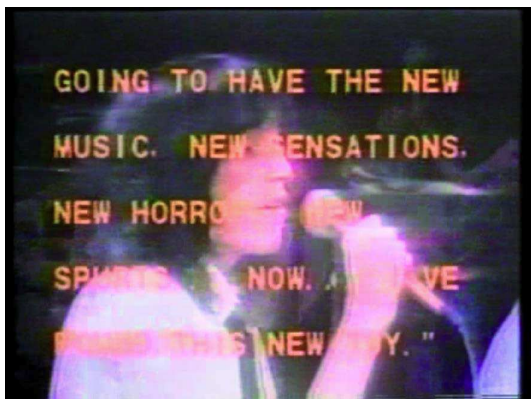
Dan Graham - Rock my religion (1982-1993)