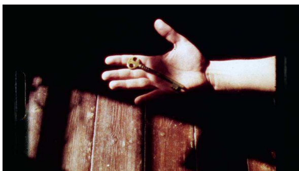
Gloria Vilches. La isla . 2015. Videoclip para la canción "La isla" de Dos Gajos. Película en super-8 transferida a digital, color, sonido, 3' 24".