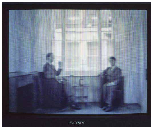
Gilbert & George - Oh, the Grand old Duke of York - Gordon Makes Us Drunk (1972)

A partir del año 2000 empieza el segundo movimiento de intensa actividad en esta práctica, que se prolonga hasta nuestros días. Esta segunda etapa está marcada por el impacto de la revolución digital y la consiguiente expansión de las herramientas de edición —de textos y de video— en el ámbito doméstico. Con el nacimiento de las publicaciones digitales, las ediciones en papel se liberan de su función principal —comunicar contenidos— y se vuelven más flexibles en relación con sus posibilidades formales y estéticas. Al mismo tiempo, tanto en los soportes impresos como el mismo celuloide cinematográfico se ven amenazados por la obsolescencia. En esta etapa, artistas de larga y reconocida trayectoria como William Kentridge y Tacita Dean, prosiguen la exploración simultánea de los dos medios al lado de creadores más jóvenes: Cine Quieto, Julián Barón, Eline McGeorge, Rob van Leijsen, Patrícia Dauder y Dominique Hurth, entre otros. La generación más joven multiplica los formatos: folioscopios o flipbooks, colecciones de postales, proyecciones de diapositivas y videoclips se unen al libro, la película y el video como soporte adecuado para este tipo de experimentación.