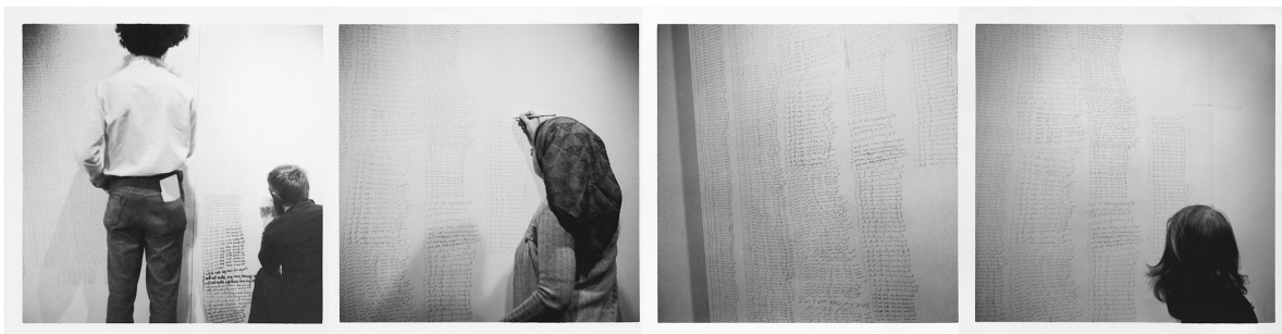
John Baldessari. I Will Not Make Any More Boring Art. Acción.

Se recreará, con la colaboración de un grupo de alumnos de la Escuela Massana, la acción I Will Not Make Any More Boring Art , ideada por John Baldessari como respuesta a una invitación del Nova Scotia College of Art and Design en 1971. En total 22 alumnos vendrán en grupos de tres, un día a la semana, para completar la acción.