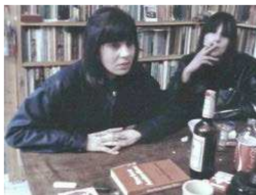
Lawrence Weiner - Passage To The North (1981)