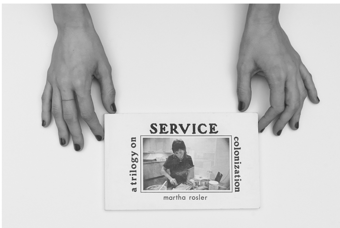
Martha Rosler. Service: A Trilogy on Colonization. Nueva York: Printed Matter, 1978 (reimpreso 2008).