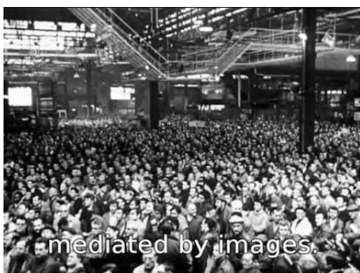
Guy Debord - La sociedad del espectáculo (1971-1973)