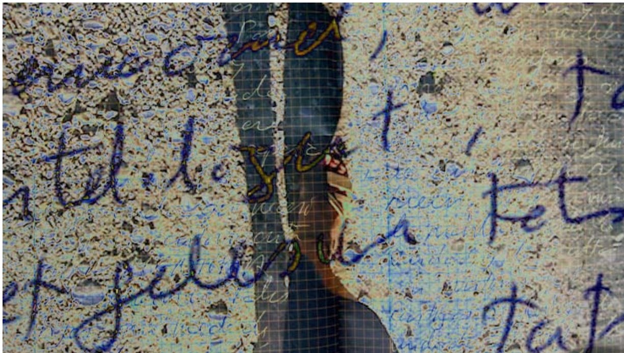
Rrose Present. Textures d'un camí