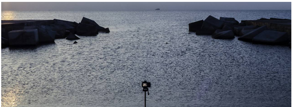
Adolf Alcañiz Autoretrat